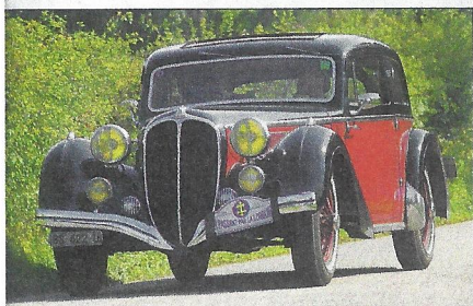
▲ Seule Delahaye du plateau, ce coach 135 M 1937 de l'équipage suisse Wenger.