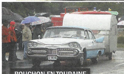
BOUCHON EN TOURAINE

Embouteillage sur la N10, comme avant l'A10 ! P.18