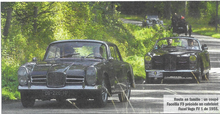
Route en famille : un coupé Facella F3 précède un cabriolet Facel Vega FV 1 de 1955.