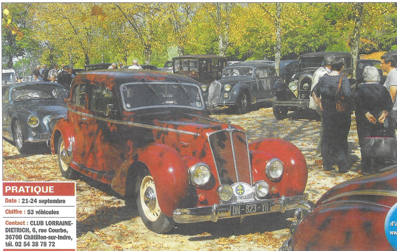
◀ Salmson, Talbot T 14 (au premier plan), et bien d'autres, à l'arrêt à Sion le temps du déjeuner, il y a rarement deux voitures de la même marque côte à côte !