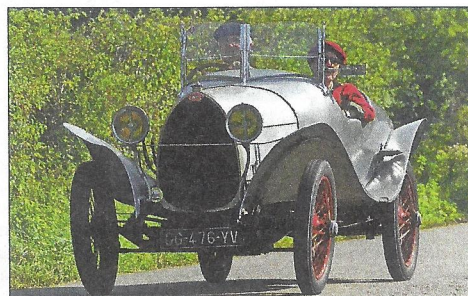
◀ L'une des deux Bugatti, une petite Brescia à carrosserie aluminium et ailes papillon.