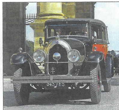
▲ Les organisateurs participaient aussi à leur berline Lorraine Dietrich B 3-6 de 1923.